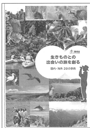
図1 国内外のエコツアー先行事例を紹介した冊子

行事例をまとめる中で、欧米では複数の旅行業界団体や企業が、野生動物に関するツアーにおける観察法や接し方についてガイドラインを設け、変化に対応するだけでなく、けん引していることを認識した（例えば、カナダのCBVA: http://www.bearviewing.ca/ ）。コロナ禍はこの変化を日本人に気付かせることを妨げている。国内では、食材となる生きものの適切な取り扱いや倫理的配慮よりも美味しさや話題性に注力している。アトラクティブな体験については、自然環境や野生生物への配慮を欠き、飼養や過度な利用を抑えてきた伝統的なシステムが活かされていないケースがみられる。欧米のインバウンド旅行者は、対象とする野生生物の生息地に身をおくと、偶然の出会いを大事にしていると聞く。今後、このようなあり