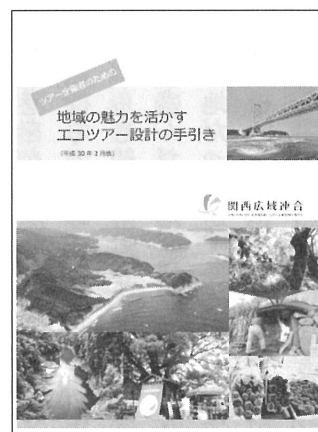
図3 エコツアーコンテンツ作成のための手引書

てまとめられるものの抽出（絞り込み）を行い、語り部や情報提供者などの協力者の洗い出しや協力の打診などを進めることになる。その後、事業を進める上での役割分担と工程表の作成を行い、確実に進める体制づくりが必要になる。また、これらの流れは、地域（事業組織）の将来像と整合性を取ることが重要である。 自然資源に配慮したコンテンツ作成と留意点の詳細については、以前、作成に関わった「ツアー企画者のための地域の魅力を活かすエコツアー設計の手引き」 https://www.kouiki-kansai.jp/material/files/group/10/ecotour-tebiki.pdf （関西広域連合・図3）に詳しい。「物語」を重視したコンテンツづくりは、詰め込み型コンテンツを回避する上でも有効であり、旅行者が求める訪問地なら