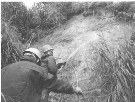
施工状況（崩壊斜面への適用例：沖縄県）

なお、沖縄県の自然公園内に生じた自然崩壊斜面（海岸斜面）に適用した例では、本工法であれば、在来種を用いることや仮設等による伐採・改変もなく、特に自然改変等がないため、管理者に確認したところ許可手続きが不要であった。