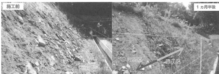
施工後の状況（農地造成法面への適用例：北海道）

現在、寒冷地であることから工事期間が短く、緑化等による融雪期の侵食防止が難しい北海道の農地造成法面への適用について試験施工を実施している。本年七月に予備試験を実施したところ、二週間程度でBSCが形成され、一カ月半後には草本類が繁茂し、植生の侵入が少ない未施工箇所と比べて明瞭な違いが確認された。寒冷地の農地では、春季（融雪期）の法面の土壌侵食により水路や水田に礫等が落下する等の課題があり、引き続き実工事をならんだ試験施工を実施していく予定